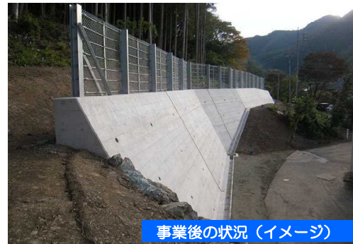
事業後の状況（イメージ）