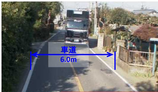
道路幅狭小・歩道未整備