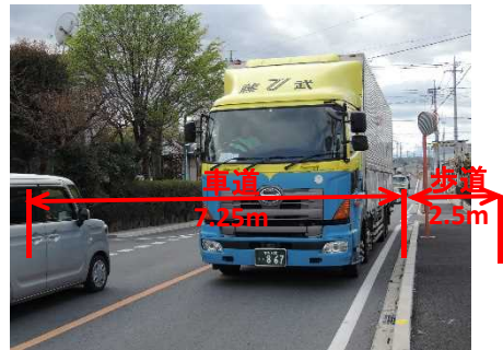
完成後のイメージ