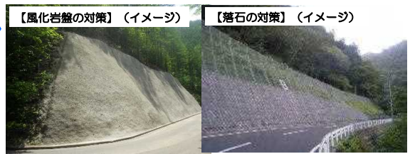
【風化岩盤の対策】（イメージ）