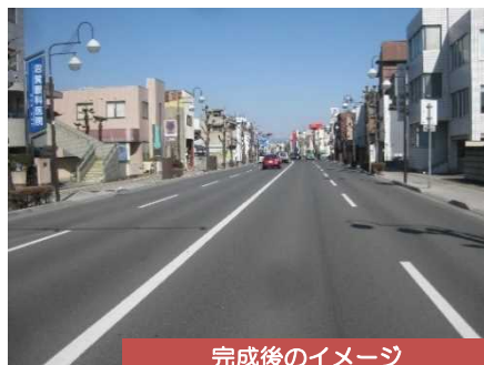
完成後のイメージ