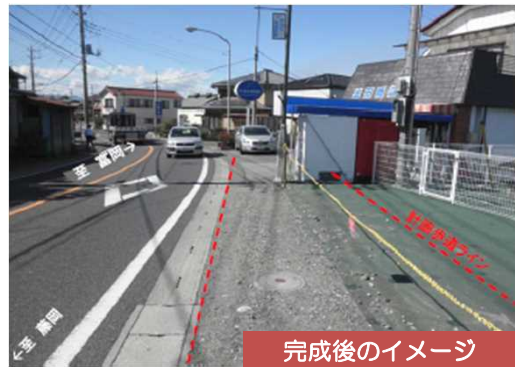
完成後のイメージ