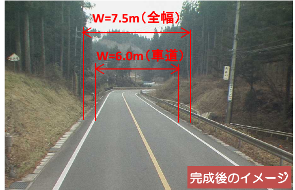
完成後のイメージ