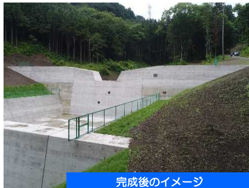
完成後のイメージ