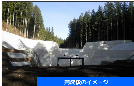
完成後のイメージ