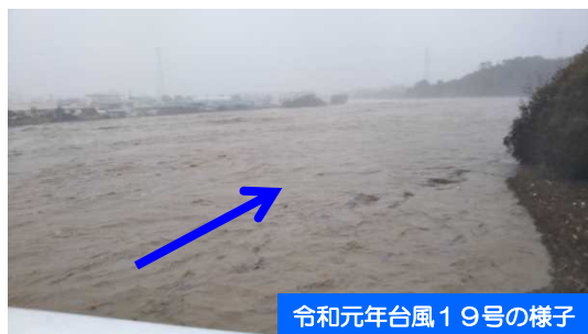
令和元年台風19号の様子