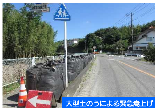
大型土のうによる緊急嵩上げ