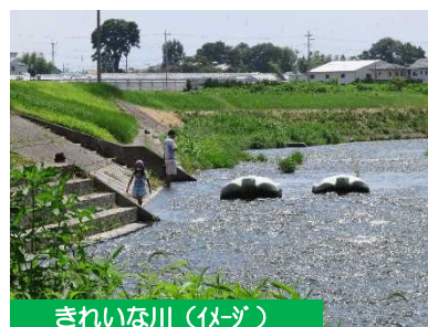
きれいな川（イメージ）