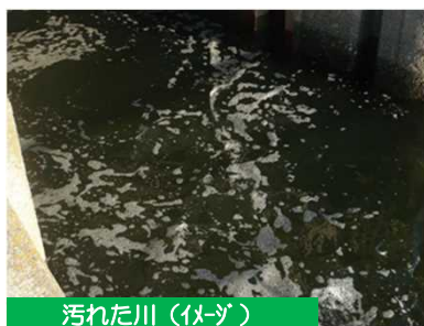
汚れた川（イメージ）