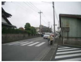
車道の端を歩く人