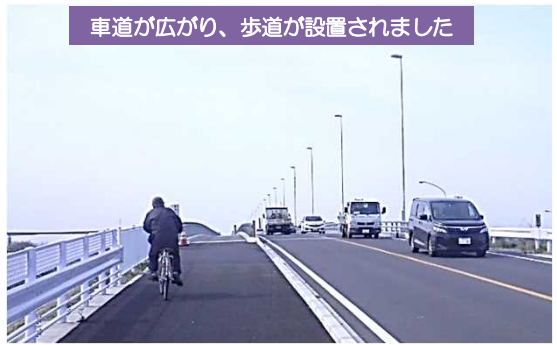
車道が広がり、歩道が設置されました