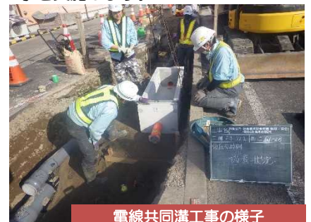
電線共同溝工事の様子