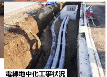
電線地中化工事状況