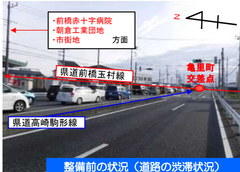
整備前の状況（道路の渋滞状況）