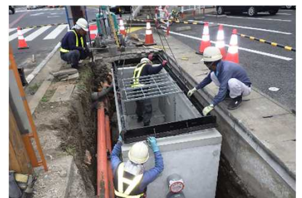
電線共同溝本体工事の様子