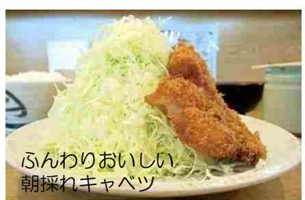
ふんわりおいしい朝採れキャベツ