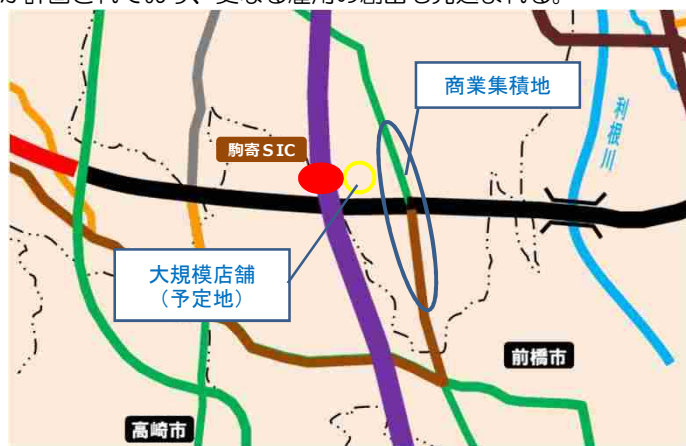
吉岡町ホームページ・吉岡町議会会議録より

駒寄SIC周辺は交通利便性が高く、小売店舗や自動車関連店舗等が立地している。駒寄SIC大型化に伴い、大規模店舗出店が計画されており、更なる雇用の創出も見込まれる。