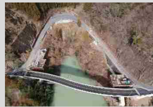
(国) 462号 藤岡市坂原地内 坂原工区[琴平大橋] (R1開通)