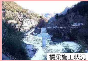
(国) 299号 神流町神ヶ原地内 古鉄橋上流工区 (R5完成予定)