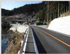
(国) 462号 神流町柏木地内 柏木工区 (R1完成)