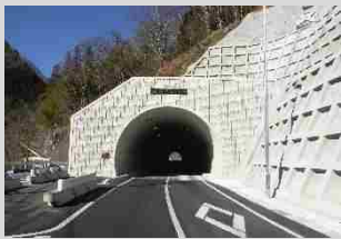
(国) 299号 上野村榎原地内 砥根平トンネル (H30開通)