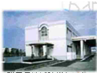
群馬県地域防災センター (大規模災害時の防災拠点)

歩道整備による日常の交通事故のリスク軽減！ 無電柱化による災害時の避難路確保！ 地域住民を日常・災害時の両面で守ります！