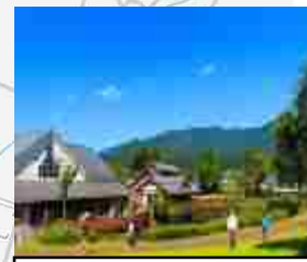
道の駅(川場田園プラザ)