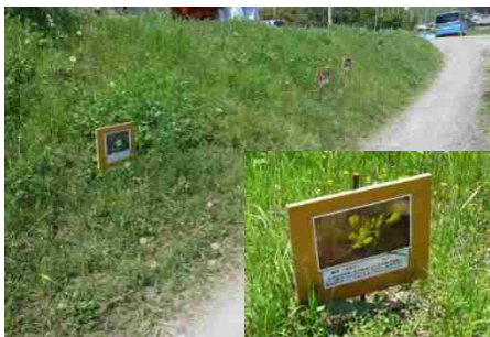
地元団体による花看板設置

○交流の場としての河川空間の整備により、地元団体による利用・管理を通じて、河川に愛着を持ってもらいます。