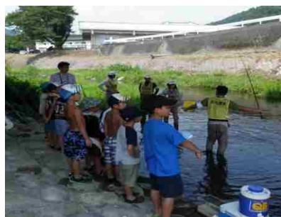
フィッシングスクール