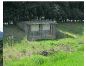
護岸にカワセミの巣となる小屋を設置しました。

○交流の場としての河川空間の整備により、地元団体による利用・管理を通じて、河川に愛着を持ってもらいます。