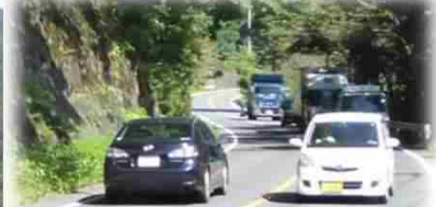
国道122号（第2次緊急輸送道路） 交通量：5,698台/日