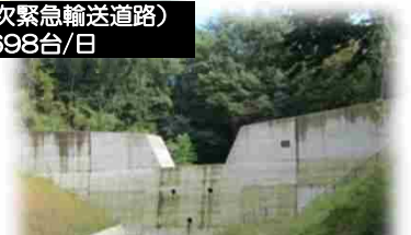
砂防えん堤（整備イメージ）