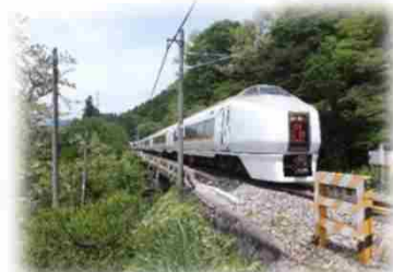
観光を支える主要交通網