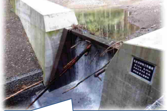
堰堤完成からわずか1ヶ月後に土石流を捕捉