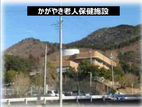
かがやき老人保健施設

要配慮者利用施設を土石流から守ることにより、利用者やその家族が安心して施設を利用することができます。