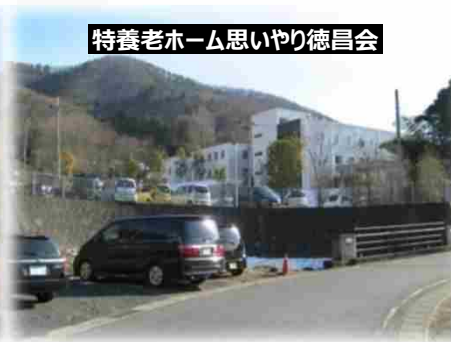
特養老ホーム思いやり徳昌会