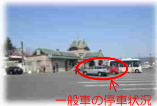
一般車の停車状況