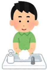
Lavar las manos