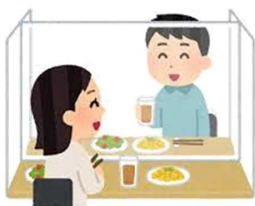
避免多人數聚餐 不使用同一盤子