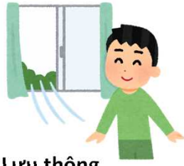
Lưu thông không khí