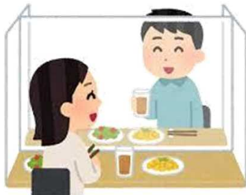
Evite comer no mesmo prato e em grande quantidade de pessoas

Evitar 3MITSU (aglomeração, lugares fechados e mantenha o distanciamento social)