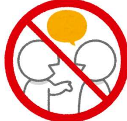
Evite falar alto