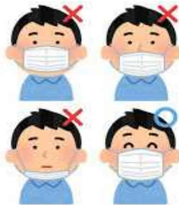
Vamos usar a máscara corretamente