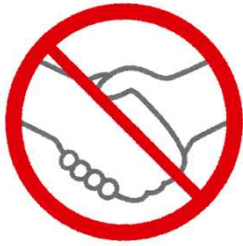
Evite aperto de mão,