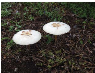
図-5 オオシロカラカサタケ（毒）