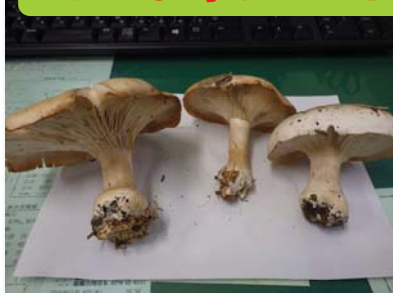
図-3 ハイイロシメジ（毒）