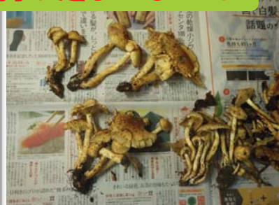
図-4 ツチスギタケモドキ（毒）