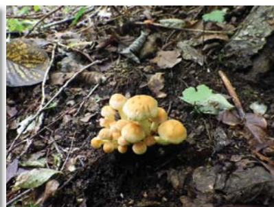
図-6 ニガクリタケ（毒）