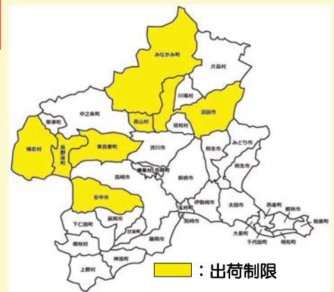
野生キノコの出荷制限区域 (R2. 7月 現在)

なお、放射性物質のモニタリング検査結果や出荷制限に関する詳しい情報は、群馬県のホームページをご覧ください。