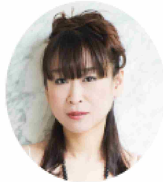
あまみや かりん 雨宮 処凛さん 作家・活動家

1975年、北海道生まれ。愛国パンクバンドボーカルなどを経て、2000年、自伝的エッセイ『生き地獄天国』でデビュー。以来、いじめやリストカットなど自身も経験した「生きづらさ」についての著作を発表する一方、イラクや北朝鮮への渡航を重ねる。