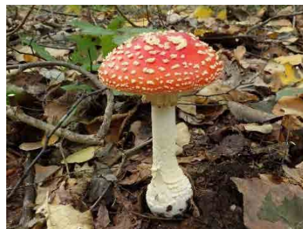
ベニテングタケ