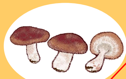
しいたけ(菌床) 群馬県産