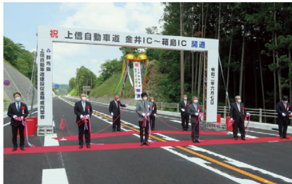
【金井IC～箱島IC 開通式（令和2年6月7日）】