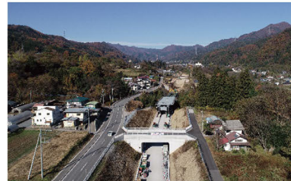
【吾妻西バイパス（事業中）】