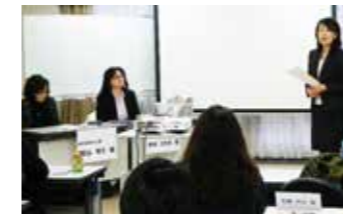
← 県内の女性起業家2人を招いたパネルディスカッション

マーケティングやWeb活用のポイントを押さえ、集客・宣伝、リピーターの作り方について学びました。また、従業員を雇用したときや取引先、金融機関等と交渉・契約するときに知っておくべきことを整理しました。最後に、事業の目標を設定し、各自発表を行いました。