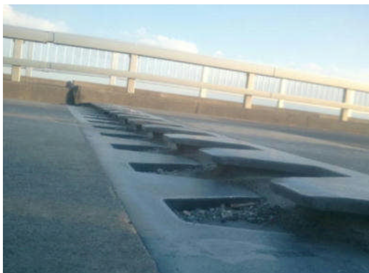
地震に伴い橋面に4cmの段差発生（国道354号：五料橋）

また地震発生直後、速やかに県内の道路パトロールを実施し、上記1箇所以外の道路構造物では異常が発生していないことを確認した。