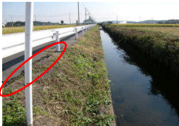
町道にひび割れ発生 (新堀川：邑楽郡邑楽町篠塚地先)

(参考) 国管理の公共土木施設の被害状況 直轄河川（国土交通省渡良瀬川河川事務所）