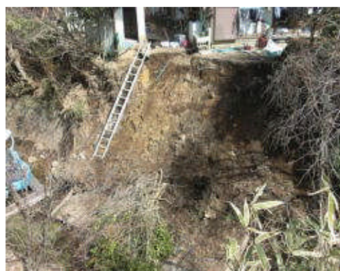
地震により溪流保全工が崩壊 (鳥井沢：桐生市黒保根町下田沢地先)

また、地震発生直後、速やかに県内の砂防施設の緊急点検を実施し、上記1箇所以外の砂防施設では異常が発生していないことを確認した。