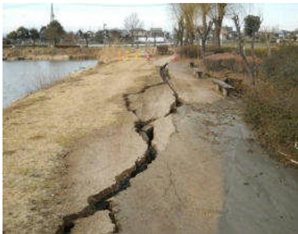
園路にひび割れ発生(近藤沼公園(館林市))

また地震発生直後、速やかに県内の都市公園施設の被害状況調査を実施し、上記 2 箇所以外の都市公園施設では異常が発生していないことを確認した。