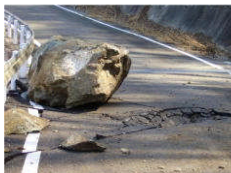
落石による市道被害＝3月、みどり市