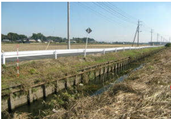
地震に伴い護岸が変状し町道にひび割れ発生 (新堀川：邑楽郡邑楽町篠塚地先)

県管理河川では、一級河川新堀川（邑楽郡邑楽町篠塚）において、地震により柵渠構造の護岸が傾き、変状が生じた。これに伴い当該河川の背後地にある町道の舗装にひび割れが発生した。本県の県管理河川における被害は1河川2箇所において、1,669千円となった。