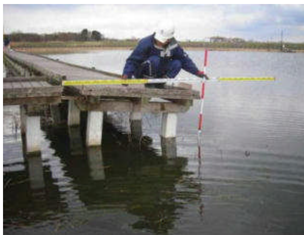
棧橋の沈下(中野沼公園(邑楽郡邑楽町))