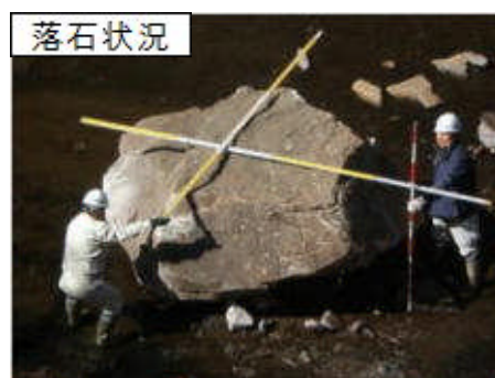
落石による市道被害＝3月、渋川市小野子