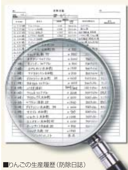
■りんごの生産履歴(防除日誌)

使用した農薬名や、希釈倍率、処理量、使用目的(病害虫名など)が記入されています。